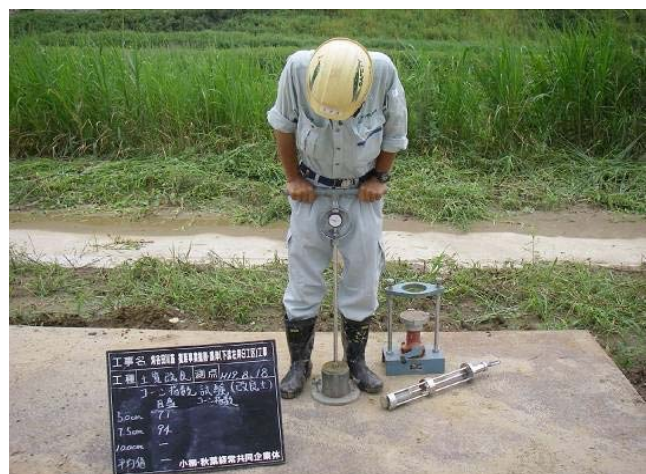
写真-3 改良土 強度測定状況