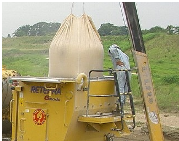
写真-2 固化材投入状況