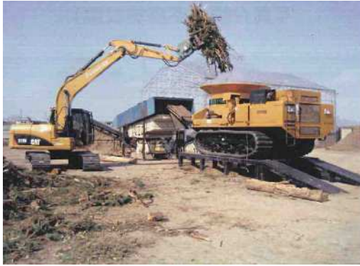
木質廃棄物の破砕作業状況