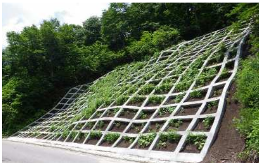
エチゴソイル植生状況(雪解け後1カ月)