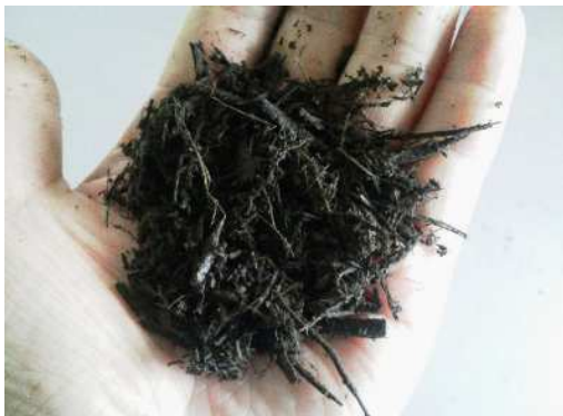
堆肥化物の拡大写真