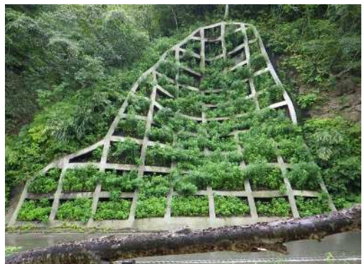
従来型バーク植生状況(雪解け後3カ月)