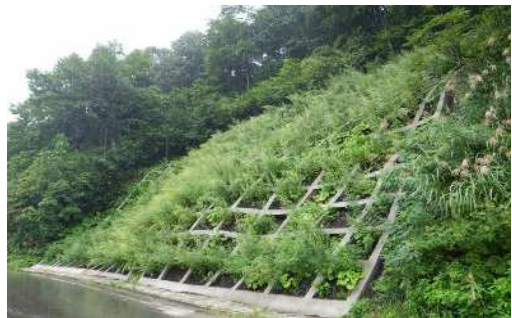
エチゴソイル植生状況(雪解け後3カ月)