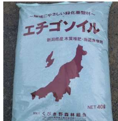
エチゴソイル製品