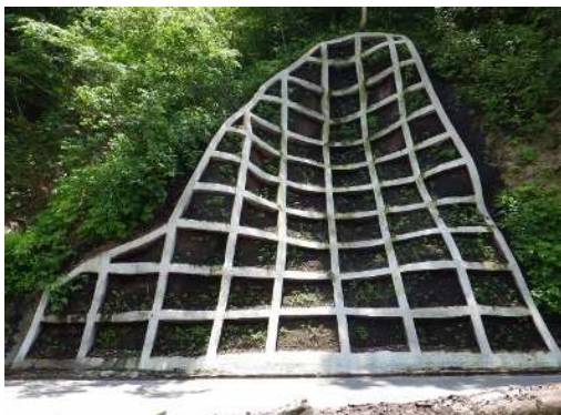
従来型バーク植生状況(雪解け後1カ月)