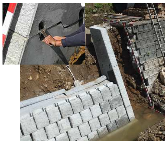
積ブロック・プレキャスト小口止ブロック設置