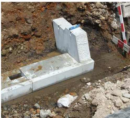
ブロック積み基礎小口止一体型設置