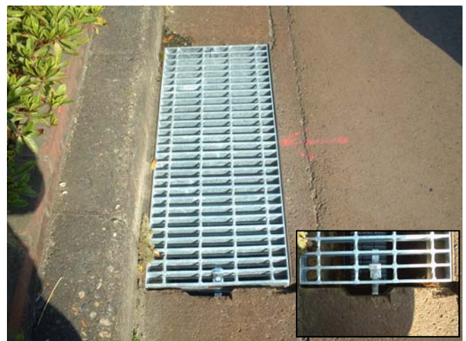
グレーチングストッパー(タイプII型-A)取付け状況(近景)