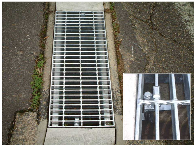
グレーチングストッパー(タイプⅡ型)取付け状況(近景)