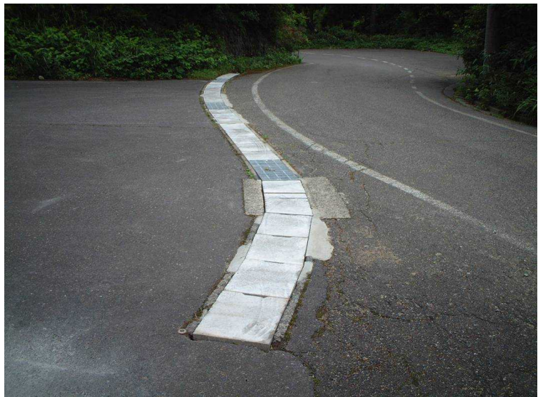
グレーチングストッパー(タイプⅡ型)取付け状況(全景)