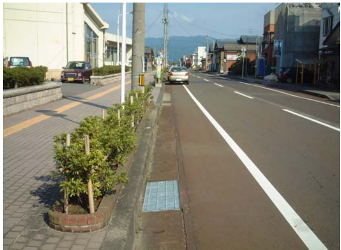
グレーチングストッパー(タイプII型-A)取付け状況(全景)