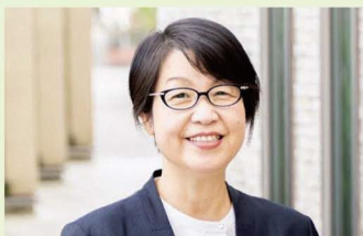
フクダハウジング(株) 代表取締役社長